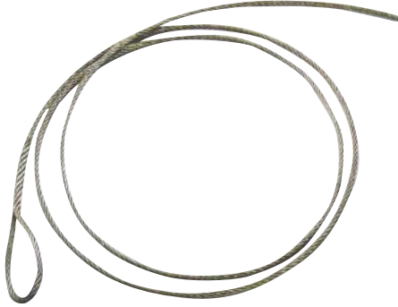
歪直しワイヤー規格寸法