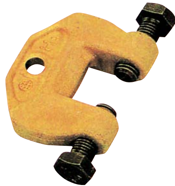
アイアンマン規格寸法