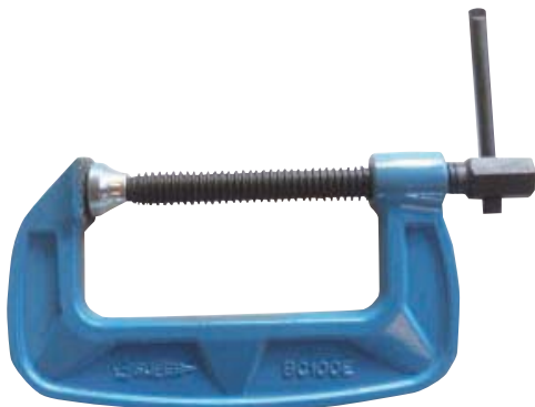
シャコ万力規格寸法