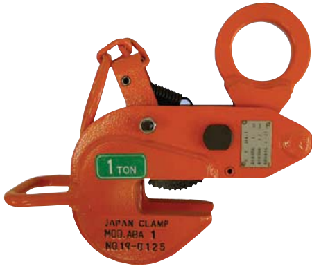
レンフロークランプABA(平吊り)規格寸法